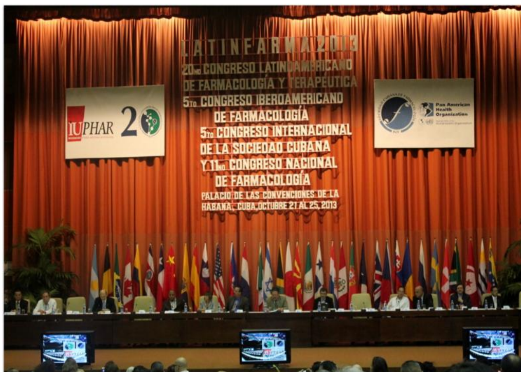
Abstracts of LATINFARMA HABANA 2013 (20 th Congreso Latinoamericano de Farmacología y Terapéutica, 5 th Congreso Iberoamericano de Farmacología, 5 th Congreso Internacional y 11 th Congreso Nacional, de la Sociedad Cubana de Farmacología. Palacio de las Convenciones de La Habana, Cuba, October 21 - 25, 2013